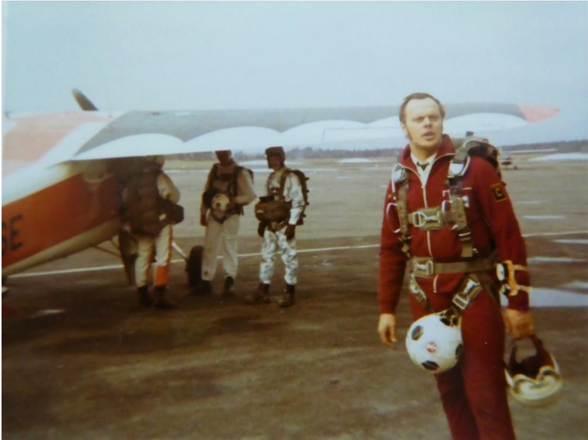
Lähdössä Stadionille näytöshypylle 3.5.1970. Alakuvassa lähestyminen lännestä tornin vierestä kentälle.