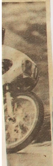
...itti B 125-kuutois- 3.